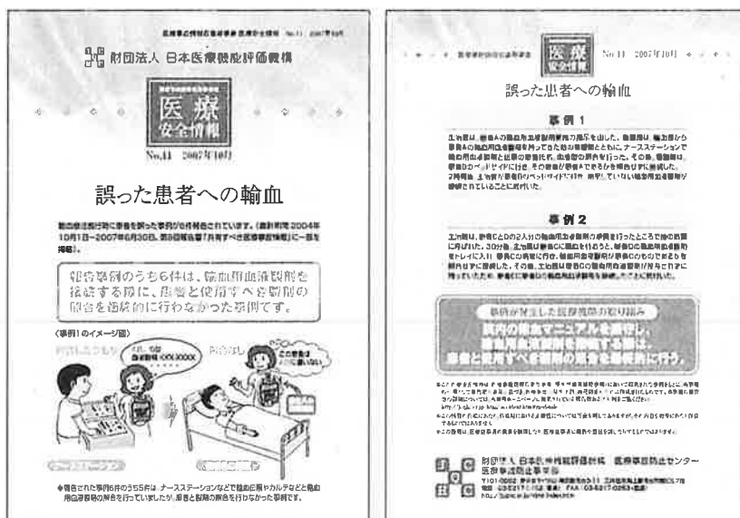
図表Ⅲ-3-14 医療安全情報No.11「誤った患者への輸血」