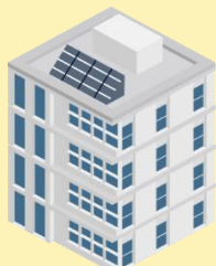
後期高齢者医療広域連合