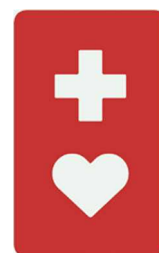
【ヘルプマーク】 所管：東京都